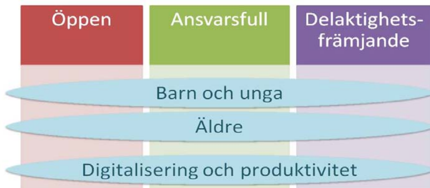
Bild 2 De Huvudmålna i handlingsplanen för öppen förvaltning 2015-2017

I Finland verkställs handlingsplanen för öppen förvaltning på samtliga förvaltningsnivåer; ministerier, ämbetsverk och kommuner. Utfästelserna innehåller målsättningar, men utfästelserna preciseras ytterligare till enskilda åtgärder och mätbara målsättningar vid ministerier, ämbetsverk, kommuner och landskapsförbund efter att verkställningen inletts. Dessa målsättningar kan ännu preciseras under verkställandets gång. Målet är att införliva främjandet av öppen förvaltning till en del av alla utvecklingsprojekt och –program. Ministerierna, ämbetsverken och kommunerna behöver inte inleda skilda projekt för öppen förvaltning, utan främjandet av öppen förvaltning ska göras till en del av all verksamhet.