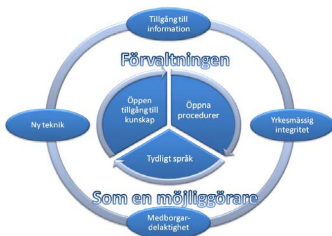
Bild 1 Den yttre omkretsen av målen för partnerskapsprogrammet internationella öppen förvaltningen och den inre omkretsen delområden av Finlands handlingsprogrammet för öppen förvaltning

Handlingsprogrammet för öppen förvaltning har verkställts sedan våren 2013. Statsrådet utgav i mars 2014 demokratiredogörelsen, med temat främjande av öppenhet och deltagande. Statsrådet har också allokerat strategiska forskningsresurser för främjandet av förvaltningens öppenhet och delaktigheten.