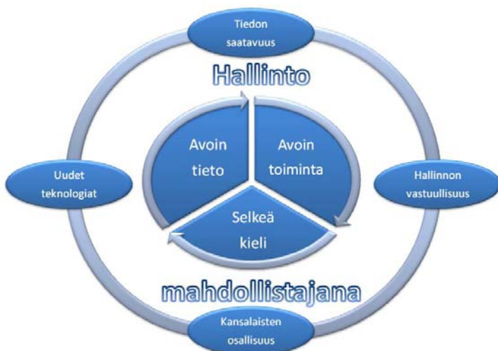
Kuva 1 Ulkokehällä kansainvälisen Avoimen hallinnon kumppanuusohjelman tavoitteet ja sisäkehällä Suomen Avoimen hallinnon toimintaohjelman osa-alueet.

Avoimen hallinnon toimintasuunnitelmaa on toimeenpantu kevästä 2013. Valtioneuvosto antoi maaliskuussa 2014 demokratiaselonteon, jonka teemana on avoimuuden ja osallisuuden edistäminen. Valtioneuvosto on myös suunnannut strategisia tutkimusvaroja hallinnon avoimuuden ja osallisuuden edistämiseksi.