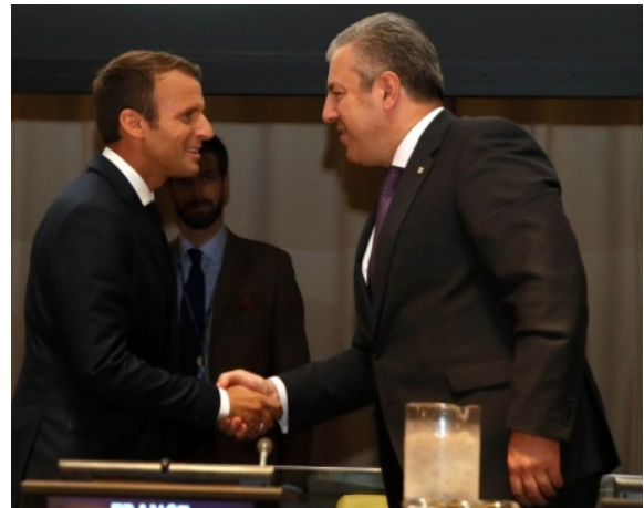
Ranskan presidentti Emmanuel Macron ja Georgian pääministeri Giorgi Kvirikashvili tapasivat #RenewTrust tapahtumassa #UNGA72.

Luottamuksen kääntäminen nousuun ja vaikiinnuttaminen hyvälle tasolle on yhteinen tavoite OGP-maille. Haagissa, Alankomaissa kokoontui 32 hallintojen ja kansalaisjärjestöjen edustajaa miettimään yhdessä, mikä OGP:n rooli, lisäarvo ja tuki tämän tavoitteen edistämisessä voisi olla. OGP:n yhteistyössä Alankomaiden sisäministeriön kanssa järjestämä kahden päivän työpaja käsitteli kysymystä erityisesti korkean tulotason maiden näkökulmasta. Tavoitteena oli jakaa ideoita, kokemuksia ja nostaa työn kunnianhimon tasoa.