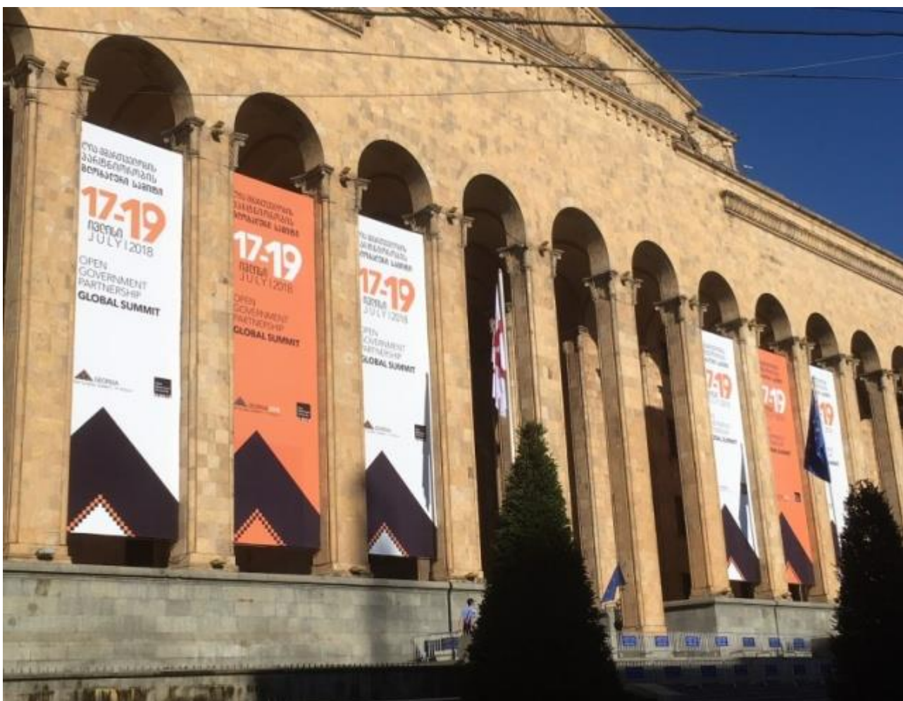
Huippukokouksen yhteydessä järjestettiin myös erillinen parlamenttien tapaaminen. Kuvassa Georgian parlamenttitalo.