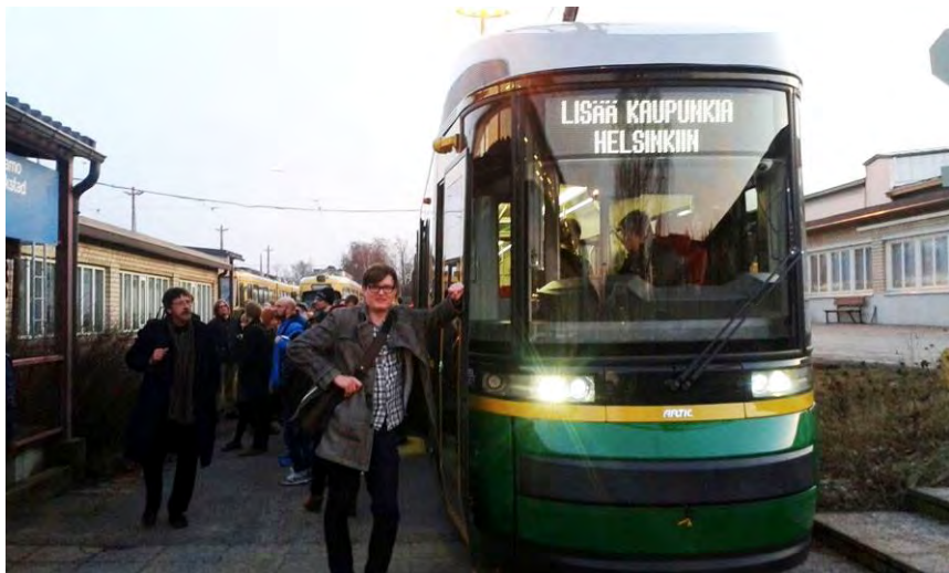
Kuva: Mikko Särelä