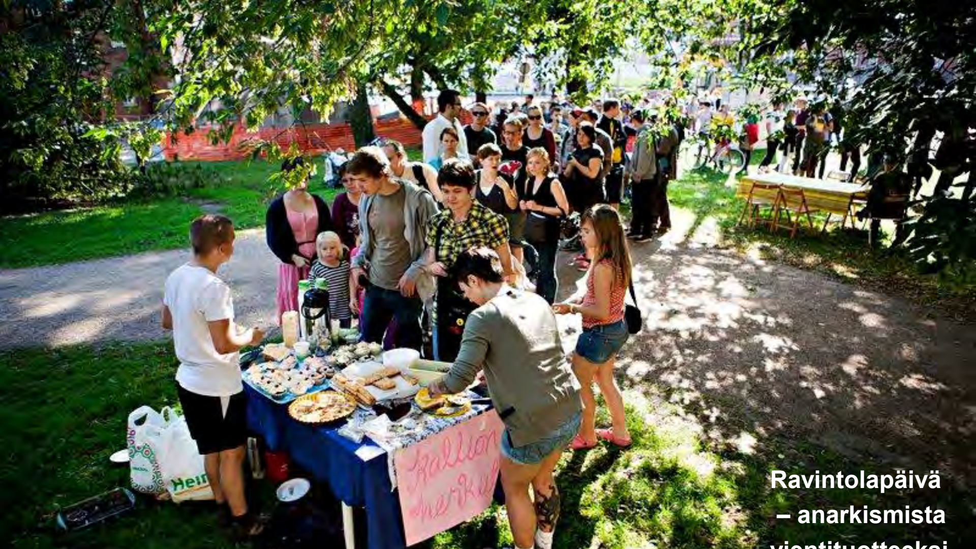
Ravintolapäivä – anarkismista vientituotteeksi