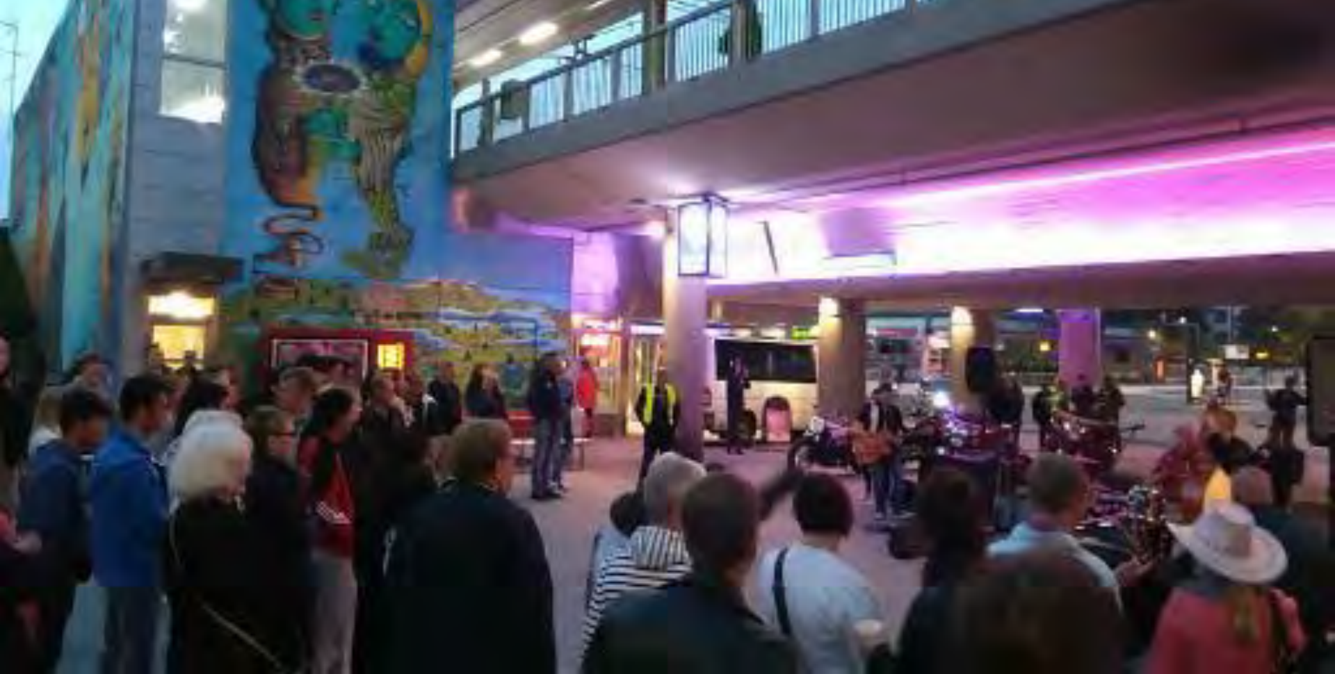
Myyrmäki-liike: asuinalueen yhteisöllisyys