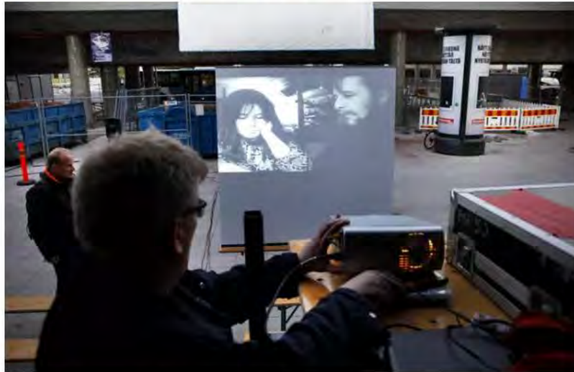
Vuonna 2014 Myyrmäki-liike valmisteli elokuvan ulkoilmanäytöstä Myyrmäen asemalla.

Myyrmäki-liike on perustanut kaikille vantaalaisille avoimen tapahtumakalustoa välittävän lainaamon.