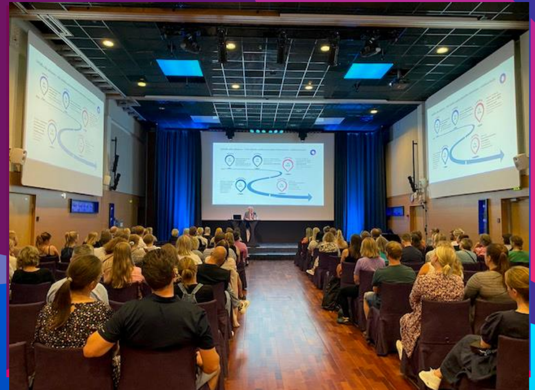
Luentoja lasten vanhemmille vanhemmuuteen liittyvistä aiheista 10 000 €