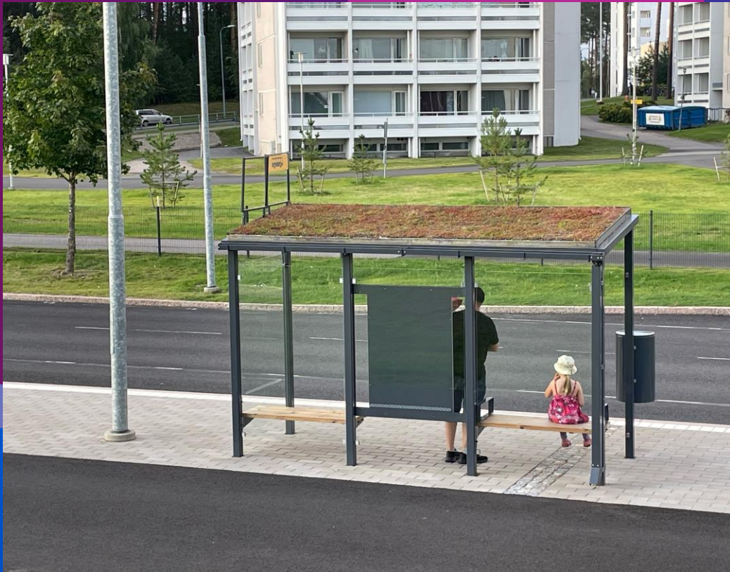
Viherkatos bussipysäkille 6800 €