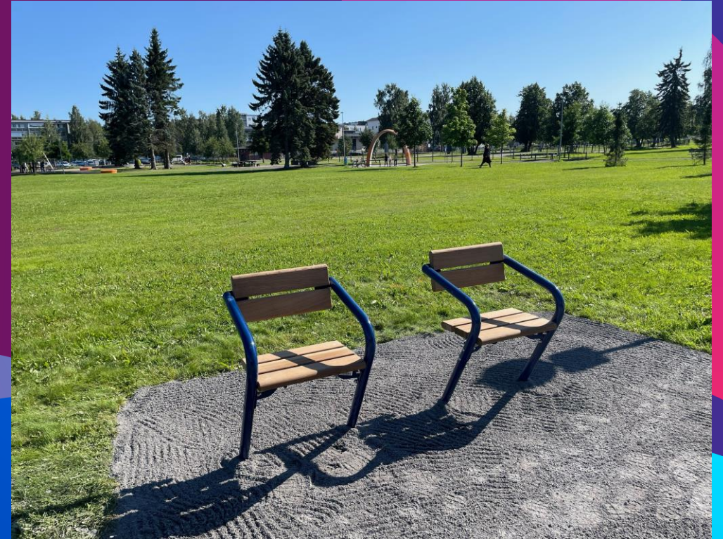
Senioripenkit Hollihakaan 14 000 €