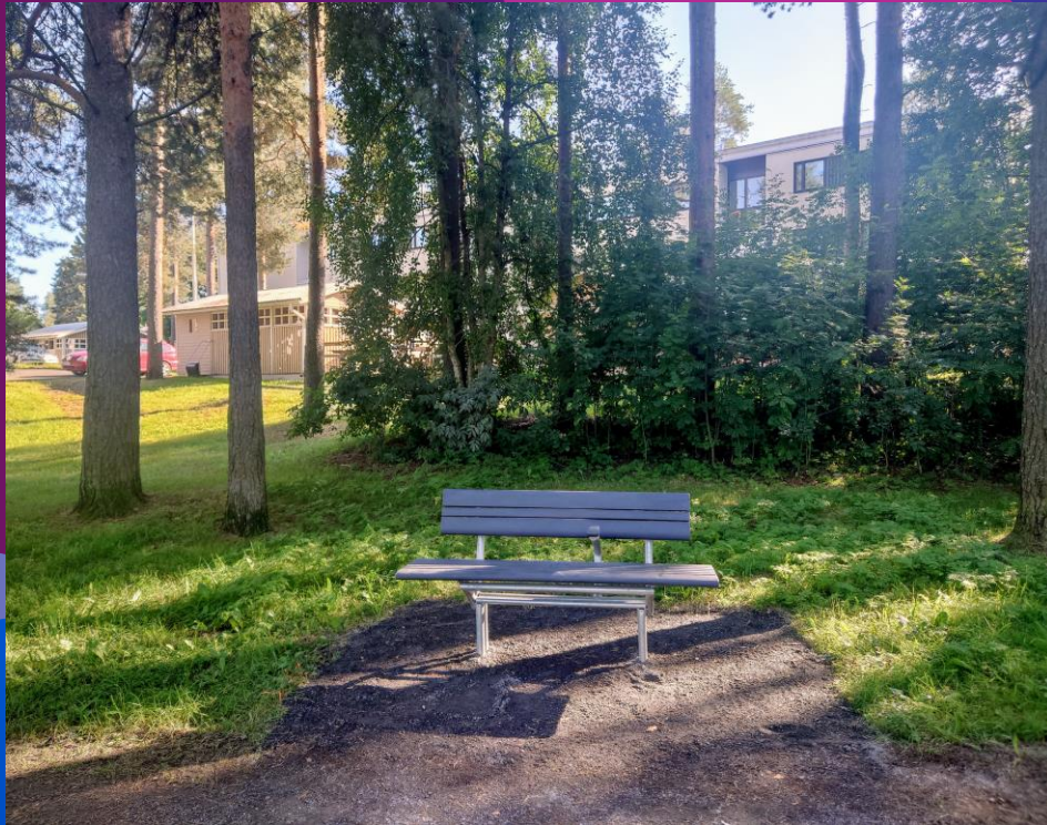
Penkkejä Vällivainion ja Alppilan kulkureiteille 5000€